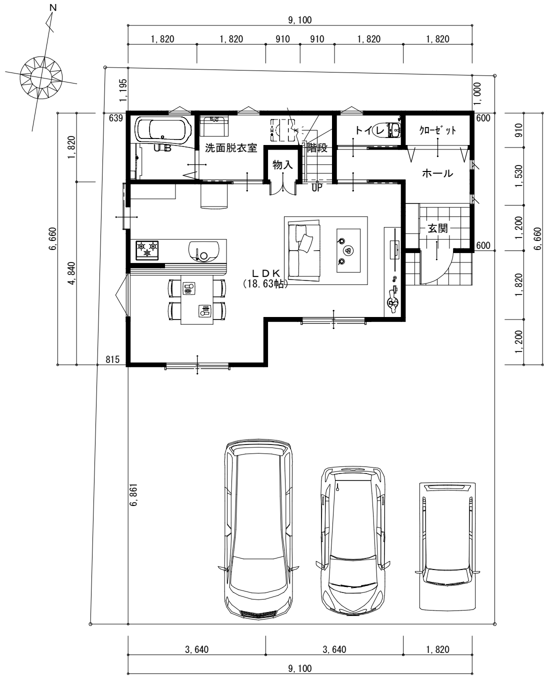
1階 平面図 S:1/100